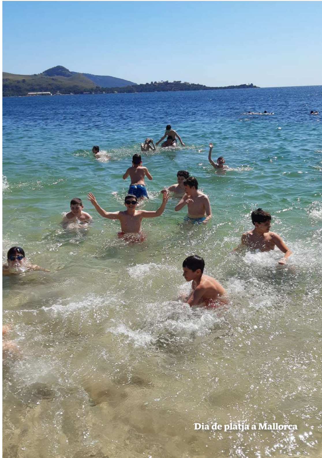
Dia de platja a Mallorca