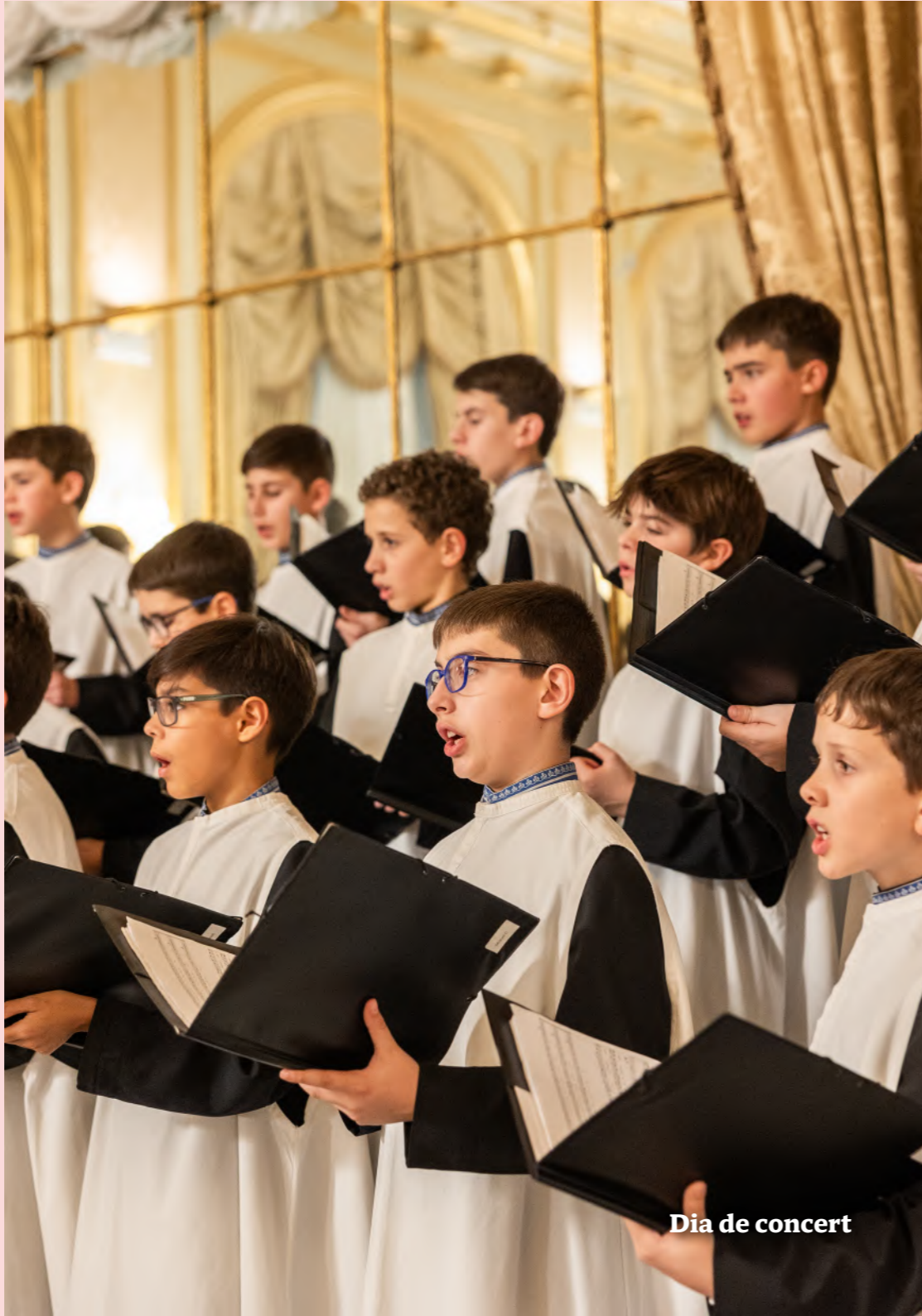
Dia de concert