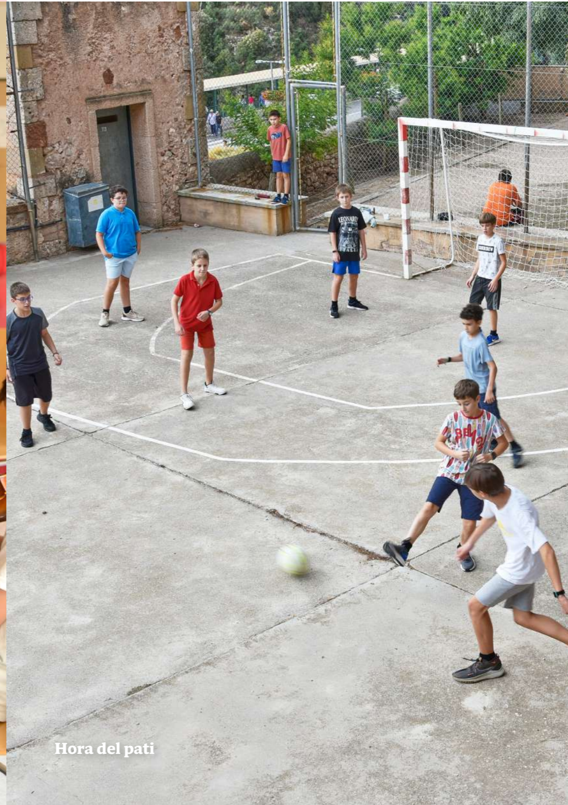
Hora del pati