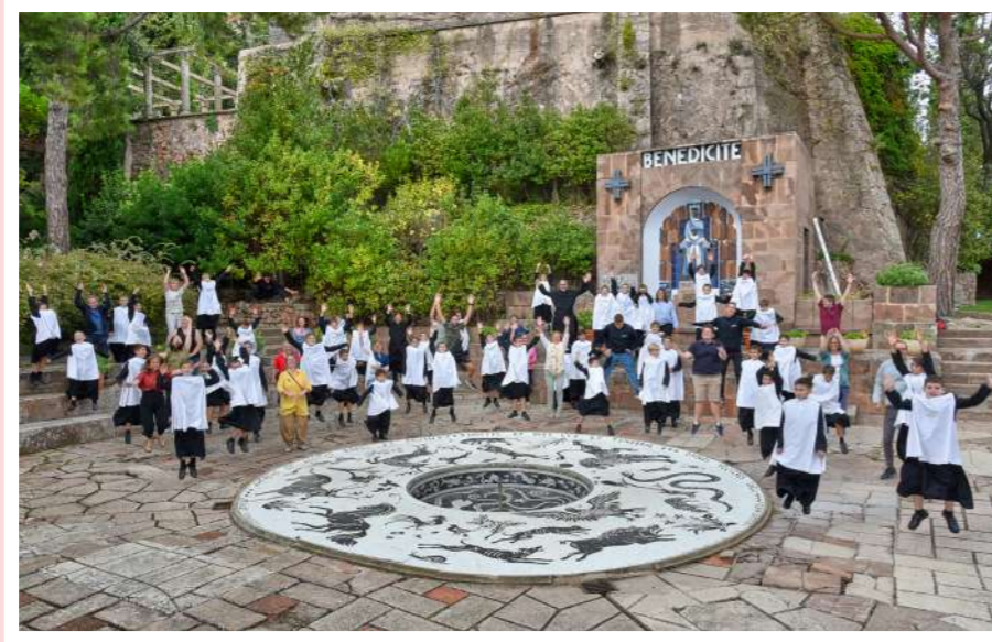
Som una gran família!