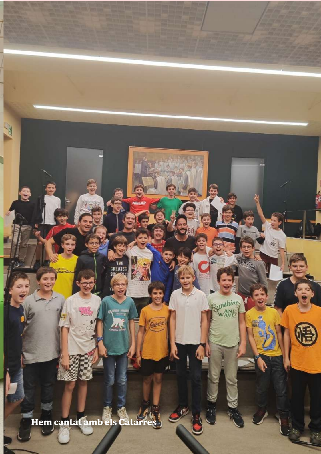
Hem cantat amb els Catarres

Hem cantat amb els Catarres Hem col·laborat en l'enregistrament de la cançó Diamants per commemorar el seu 10è aniversari. Una experiència inoblidable.