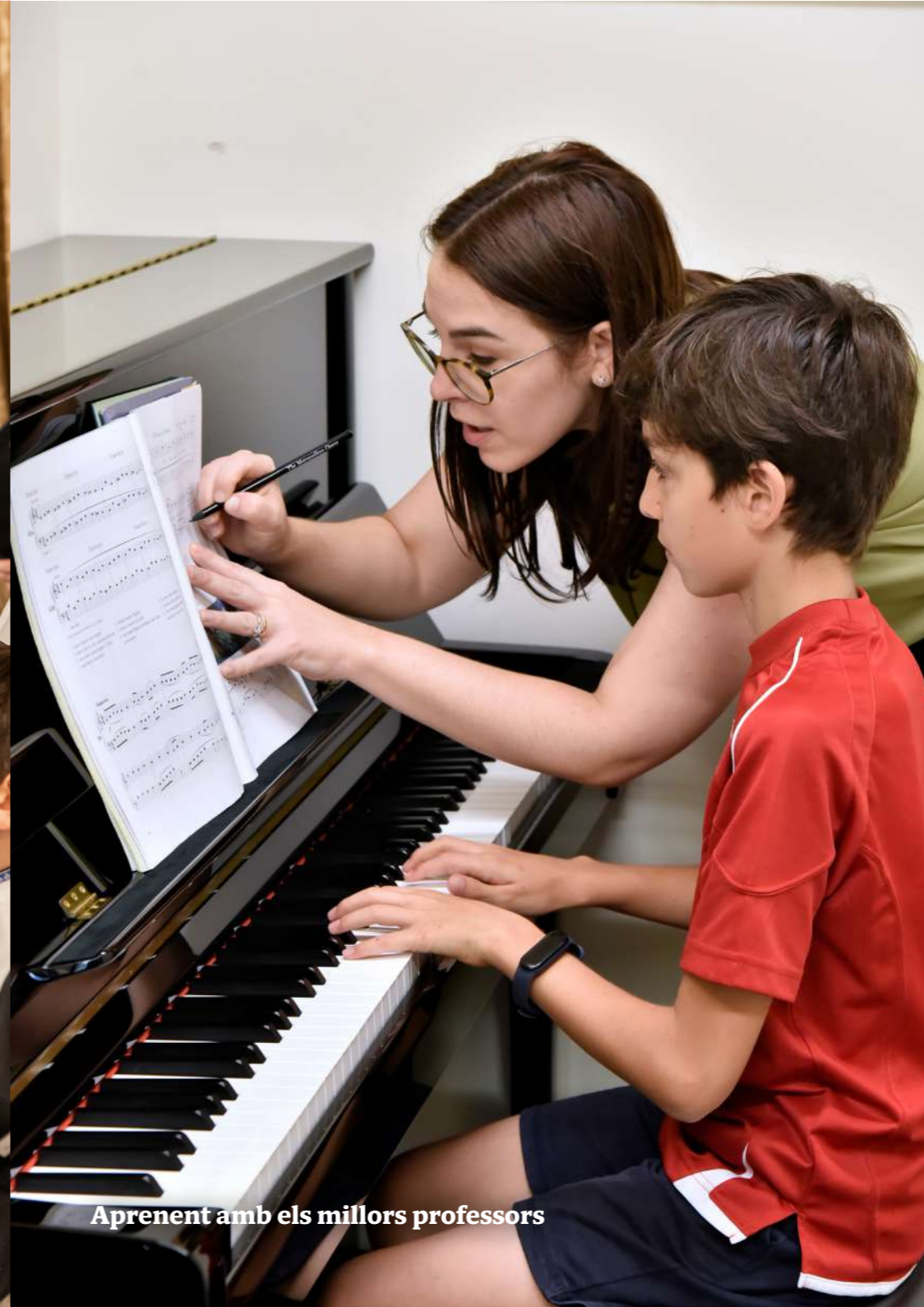
Aprenent amb els millors professors

Amb el suport del Departament d'Educació i Formació Professional Generalitat de Catalunya Departament d'Educació i Formació Professional