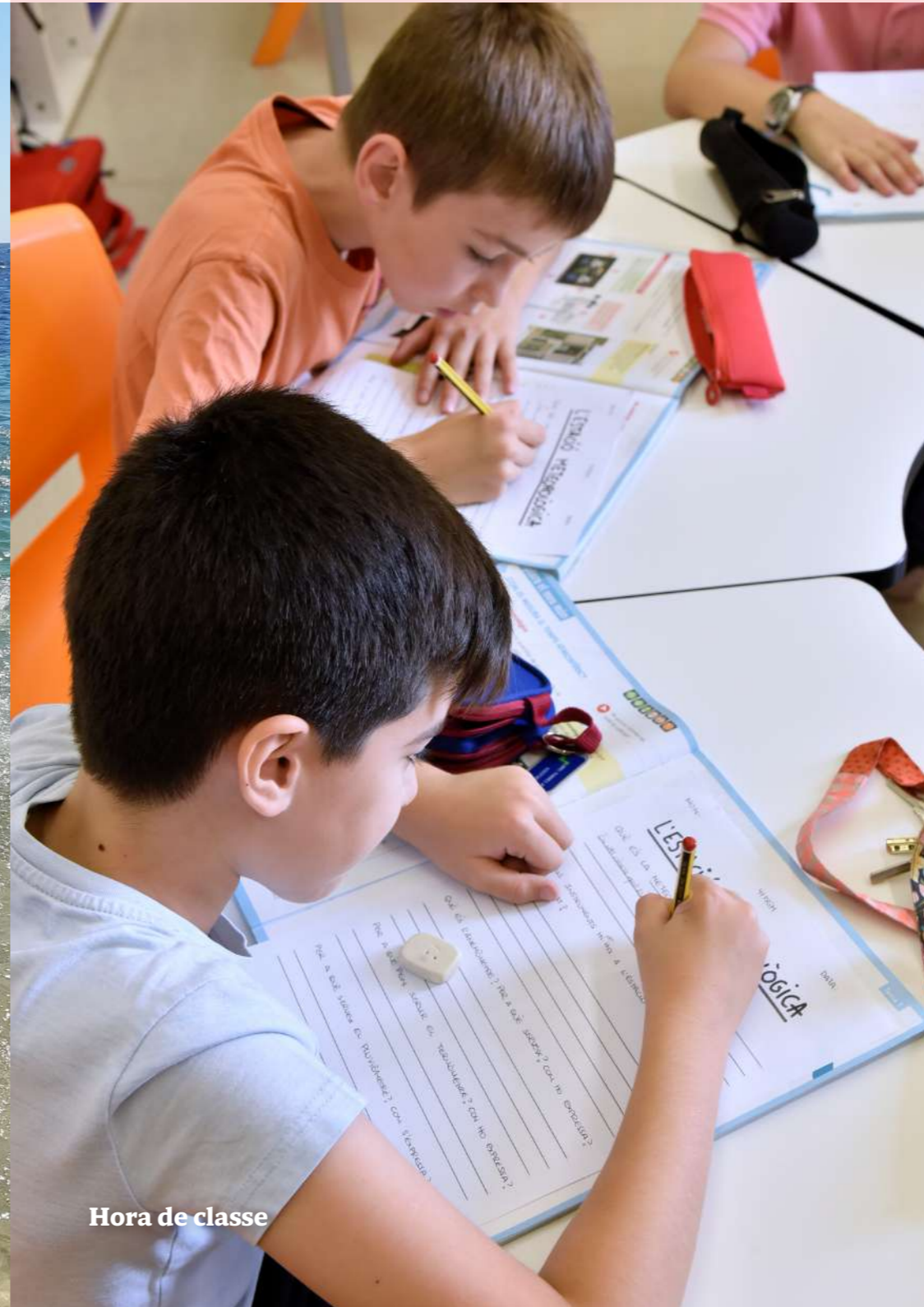
Hora de classe

Hem cantat amb els Catarres Hem col·laborat en l'enregistrament de la cançó Diamants per commemorar el seu 10è aniversari. Una experiència inoblidable.