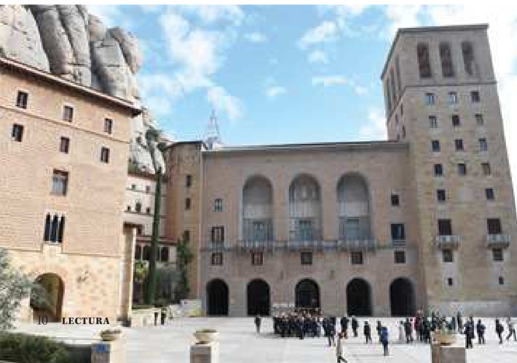
ICONA. El monestir benedictí, als peus de l'emblemàtica serralada, és un referent espiritual i de país.