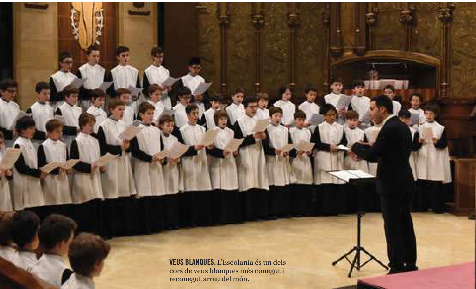
VEUS BLANQUES. L'Escolania és un dels cors de veus blanques més conegut i reconegut arreu del món.