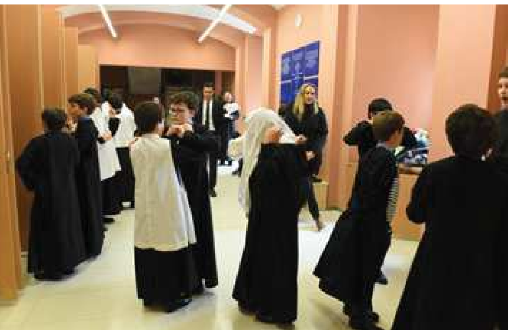
PREPARATIUS. Els escolanets preparant-se per al seu gran moment. L'ambient es distès, sense nervis.